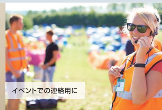
イベントでの連絡用に